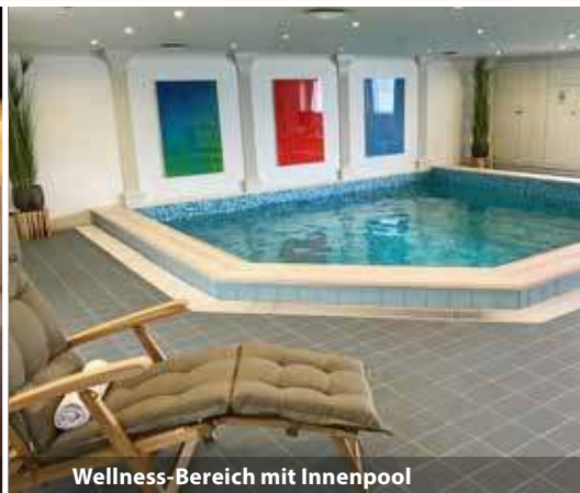
Wellness-Bereich mit Innenpool