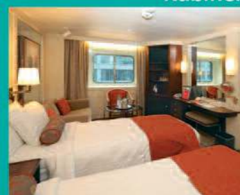
2-Bett, außen diverse Decks (Kat. I, K, L, M, O)