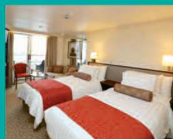
2-Bett, Superior PLUS, außen Balkon, Apollo-Deck (Kat. Q+)