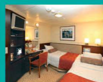
2-Bett, innen diverse Decks (Kat. E, G)